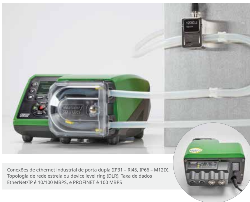
Conexões de ethernet industrial de porta dupla (IP31 – RJ45, IP66 – M12D). Topologia de rede estrela ou device level ring (DLR). Taxa de dados EtherNet/IP é 10/100 MBPS, e PROFINET é 100 MBPS